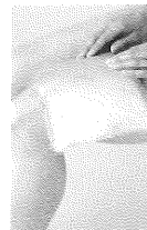
◆広い患部をしっかり カバー