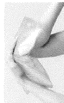
◆関節にクールと フィット